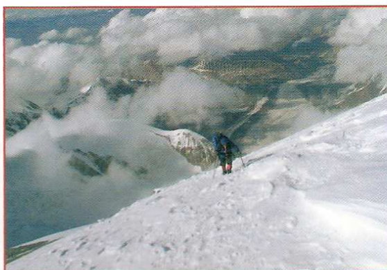
Des paysages à couper le souffle

On récupère quelques heures de sommeil, on discute, on fait fondre de la glace pour la boire...et on programme les journées à venir. Finalement, les volontaires ont décidé d'atteindre le sommet d'une traite. A ce moment, on se remet en question et on prend la décision de se lancer ou non. Quatre d'entre